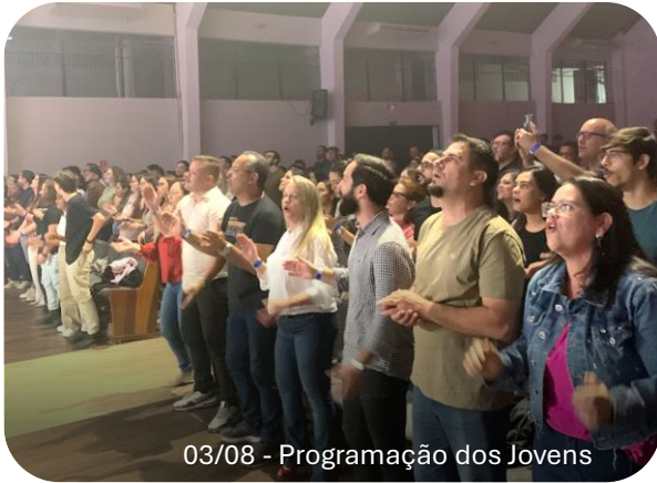
03/08 - Programação dos Jovens

agora com uma edição mensal, com informações mais dinâmicas de tudo o que é destaque, seja a apresentação de um bebezinho em nossos cultos, seja para divulgar programações vinculadas à nossa querida igreja.