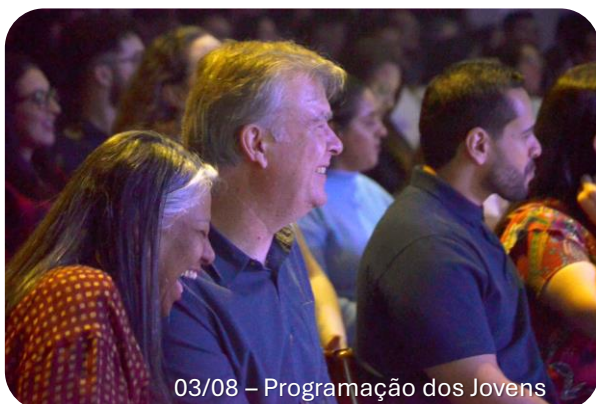
03/08 – Programação dos Jovens