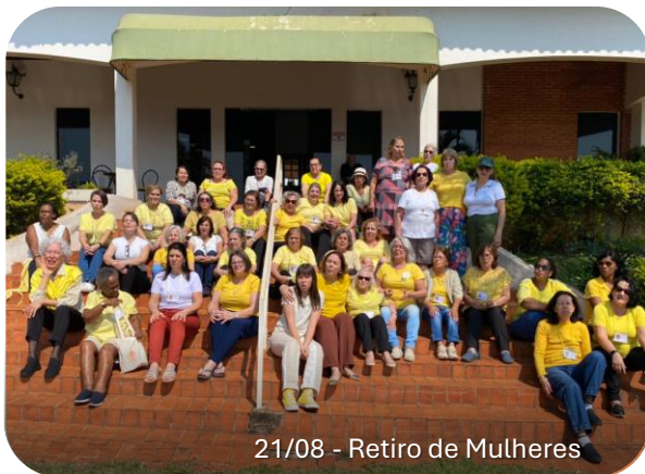
21/08 - Retiro de Mulheres

Neste ano de 2024, nosso Deus tem nos abençoado de forma especial em todos os desafios que foram propostos, pois tem sido realizados pela misericórdia de Deus. Uma dessas ações é o “Alvará de Funcionamento” que tem sido um alvo diário da administração da igreja, onde já se encontra na fase final, motivo de grande alegria para a igreja quando for atingido!