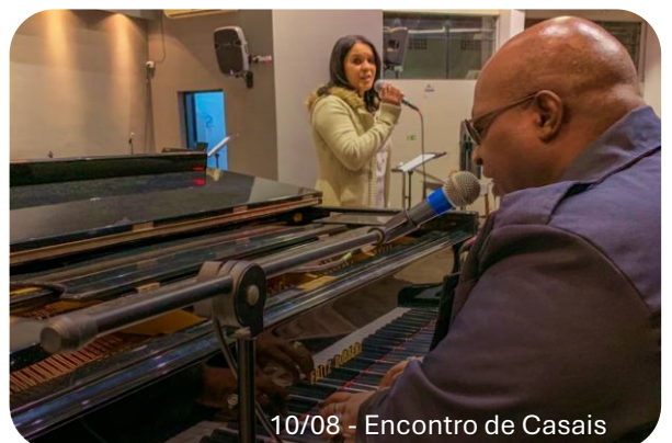
10/08 - Encontro de Casais