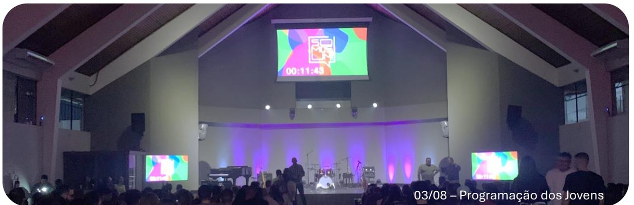
03/08 – Programação dos Jovens