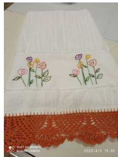
Foto: trabalhos realizados na Oficina Dorcas - mulheres que trabalham pro Reino de Cristo.