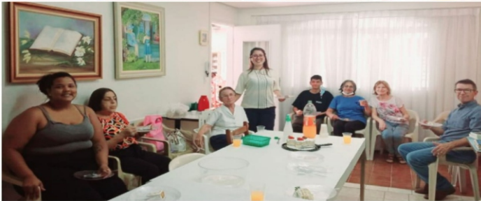
Foto: na Oficina Dorcas, mulheres que trabalham pro Reino de Cristo.