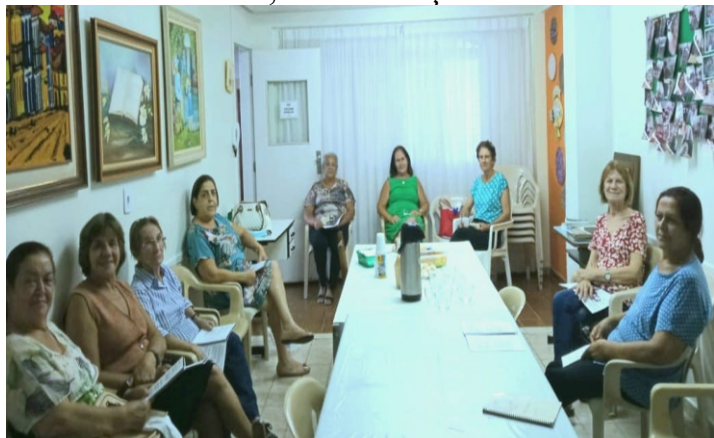
Foto: na Oficina Dorcas, mulheres que trabalham pro Reino de Cristo.