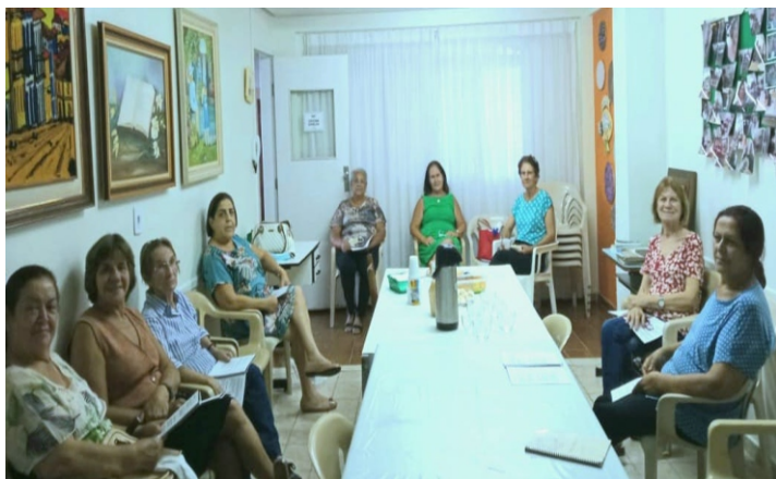
Foto: na Oficina Dorcas, mulheres que trabalham pro Reino de Cristo.